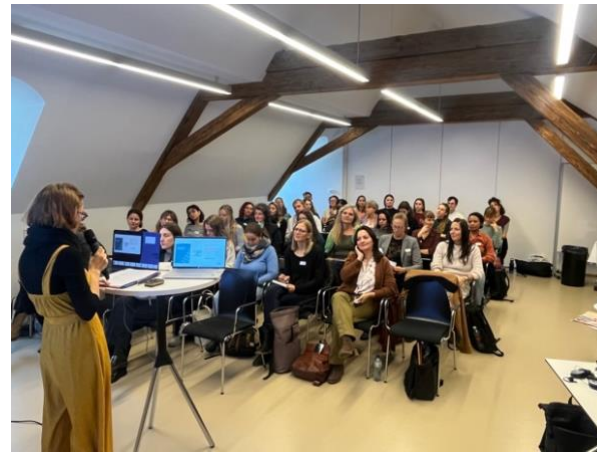
Cinq ans de la Plateforme Traite, photo : Plateforme Traite

Comme chaque novembre, ASTRÉE soutient la campagne « 16 jours contre la violence basée sur le genre » dont le focus est mis pour 2025 sur la violence de genre et le handicap . Outre la participation au groupe de travail et le soutien financier, ASTRÉE participera à divers événements organisés par les organisations partenaires de la campagne. Pour plus d'informations → https://www.16jours.ch