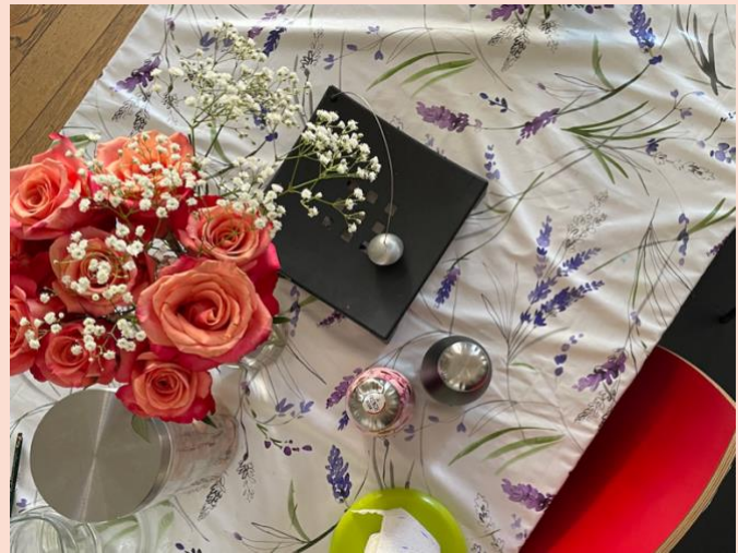
Cuisine du foyer d'ASTRÉE

Depuis le début de l'année et jusqu'à mi-novembre, 68 nouvelles personnes se sont annoncées à ASTRÉE. Sur ce total, 37 personnes ont été reconnues victimes dont une mineure ; 32 sont des femmes et 5 des hommes ; 28 situations concernent l'exploitation de la prostitution et 12 des situations de travail forcé (trois personnes ont subi ces deux formes de traite). Avec ces personnes, 11 enfants (qui ne sont pas elles/eux-mêmes victimes) sont au total pris en charge par le dispositif d'ASTRÉE. Huit situations sont en cours d'évaluation et 23 personnes, non victimes de traite, ont été réorientées auprès des services d'aide concernés.