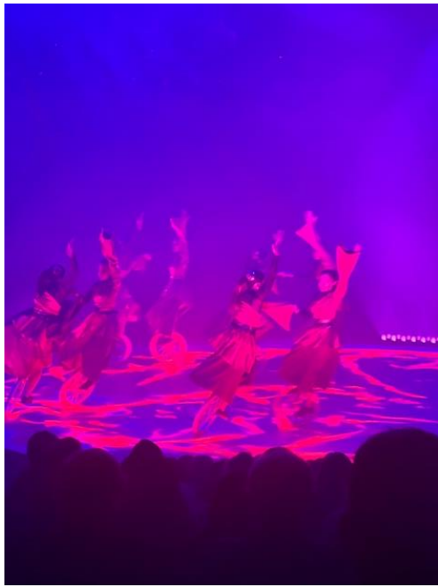
Sortie au cirque Knie